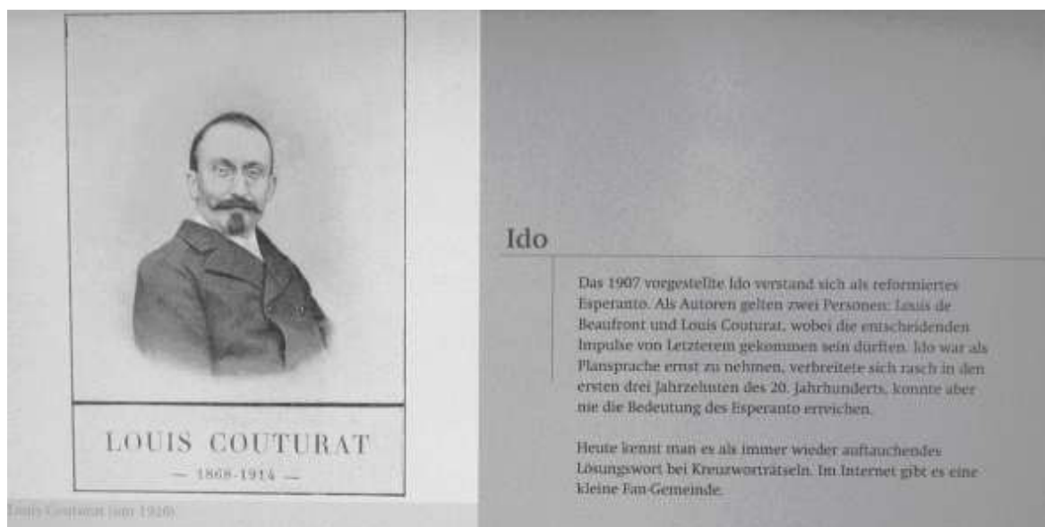
Parto di expozo-tabelo pri Louis Couturat en Esperanto-muzeo Wien

La historiala dokumenti montris, ke Napoleon konjekteble kaptesis da stomak-kancero pro la bakterio Helicobacter pylori. Posible ca risiko plu-gravigesis pro la lore uzata maniero nutrar su dum kampanii. Arseno trovita en la hari di la mortinto dum la yaro 2001 nutris l'olda teorio di venen-ocido, quan la grupo di Gentas nun konsideras kom par-finita. Segun AFP/ND (gs)