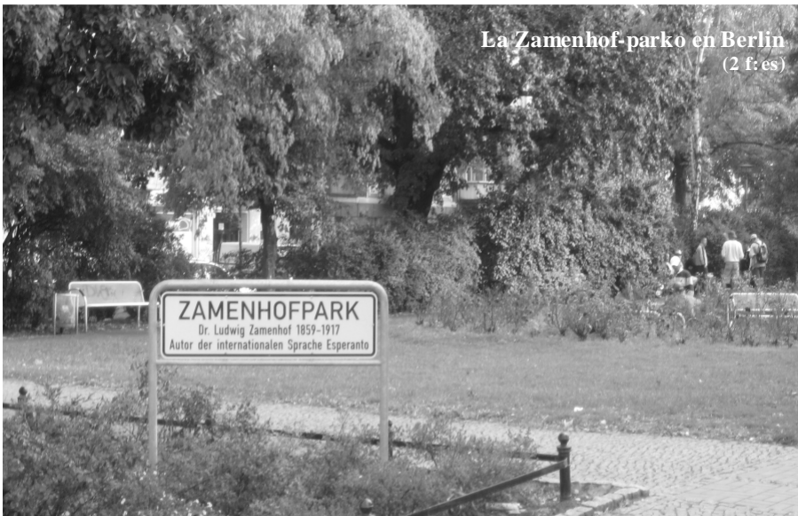
La Zamenhof-parko en Berlino (2 f. es)