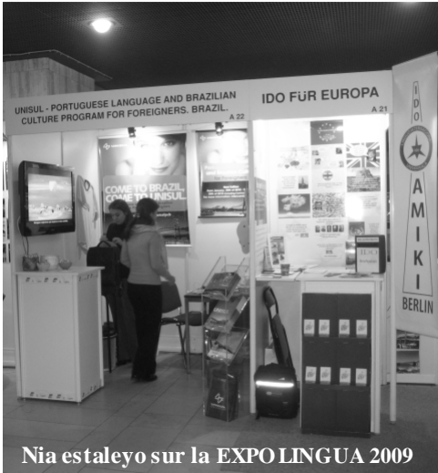
Nia estaleyo sur la EXPOLINGUA 2009